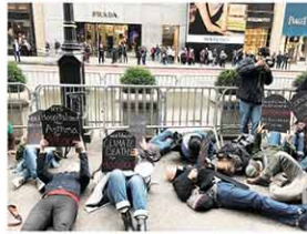
ツイッター (@NYRenews) より

10月29日付amニューヨークによると、気候変動や環境汚染が原因で死亡した人の数を書いたプラカードを持った人が路上に寝転んで抗議。参加者は「私たちのたった1つの星、私たちは地球を守る」と声をそろえた。参加者らは寝転んで死んだふりをする事で政権の環境対策が死人を