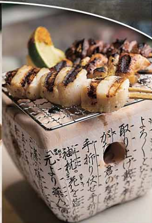
写真上 omakase Starter / $100 Full / $130 Premier / $160 prefix / Seasonal tasting menu / $125 左下 seasonal uni don / Market Price 中央 dobin mushi / $14 右下 Robata Protein Flight / $20