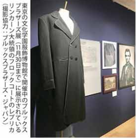
リンカーンが着用していたフロックコート。1861年11月30日、このコートは展示された。リンカーンが着用していたフロックコート

エイブラハム・リンカーン(1809~65年)は、米国初の共和党所属の大統領だ。奴隷制か工業化かで合衆国を2分した南北戦争(1861~65年)で合衆国軍(北軍)を指揮し、類稀なるリーダーシップ