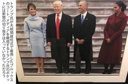
トランプ氏が大統領就任式で着用したブルックスのトラントメテアを贈呈するトランプ氏のホウテスには新聞の切り抜きが入っていたという