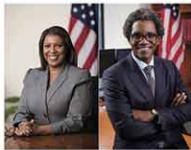
ジェームズ氏(左)とウォフォード氏(右)

リュウ・クオモ知事や州議会議員との親密 さを挙げ、汚職取り締まりについて公平に 法的制約を科せるか疑問だと批判。ジェ ームズ氏は相手を問わす汚職と闘うと反論し た。10月初旬の支持率の世論調査では50% 対30%でジェームズ氏がリード。どちらが 選ばれても、州で初のアフリカ系司法長官 となる。