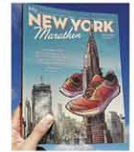
2016年にフランスで出版された。

ト前の興奮は忘れられない」と話す。途中、「体がガタガタして」悪戦苦闘。その体にムチを入れる様子もコミカルに描いている。「物語を終わらせなければならぬ」と完走。タイムは5時間44分だった。3日にはマンハッタン区の紀伊國屋書店で同書のサイン会が予定されている。