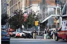
10月31日の暴走トラックテロ現場

提示する運転免許証に記載された署名と同様の署名がされた身分証明書の提示を求める他、車の鍵は対面で渡す、借り手の挙動が不審でないか確認するなどの項目も含まれる。