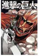
漫画「進撃の巨人」第1巻の表紙(共同)

れるという妄想をしていました。現実となり、これ以上は望めないほど幸運な思いで満たされています」とのコメントを出した。 「進撃の巨人」は、少年エレンと巨人との戦いを描くダークファンタジー。(共同)