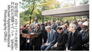
10月28日、マンハッタン区アッパー・イーストサイドのエマヌエル寺院で行われた追悼イベントの様子。

事件を受け、市警察(NYPD)元警官のブルックリン区エリック・アダムス区長は市内の警官に対し、教会に行く際は勤務時間外でも拳銃を携帯するよう奨励した。