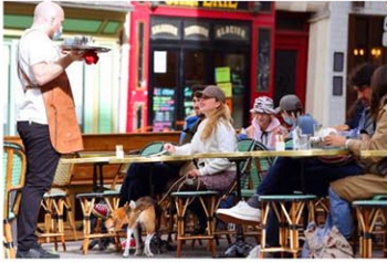
19日、パリ・モンマルトル地区のカフェでテラスに座席した客ら

【パリ共同】フランス政府は19日、新型コロナウイルス対策規制の段階的緩和で、カフェやレストランのテラスでの営業を昨年10月末以来、半年以上に認めた。商店の