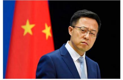
記者会見する中国外務省の趙立堅副報道局長=19日、北京

趙氏は、ペロシ氏が政治的な偏見に基づき、新疆ウイグル自治区を巡る「いわゆる人権問題」を理由に中国を中傷していると主張。