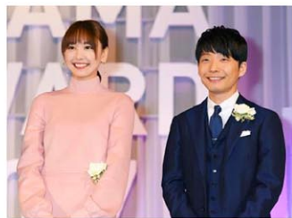
2017年10月、東京ドラマアワードで「逃げるは恥だが役に立つ」が連続ドラマ部門グランプリに選ばれ、笑顔の星野源さん(右)と新垣結衣さん＝東京都港区

2人は2016年放送のTBS系ドラマ「逃げるは恥だが役に立つ」で“契約結婚”する夫婦を演じ、今年1月にも同ドラマのスペシャル版で共演した。星野さんが歌