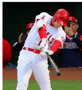
インディアンス戦の1回、3試合連続本塁打となる14号ソロを放ったエンゼルス大谷=アナハイム(共同)

ドジャースの筒香はダイヤモンドボックス戦に「7番・左翼」でレイズから移籍後初出場し、六回まで1打数無安打、2四球1三振。