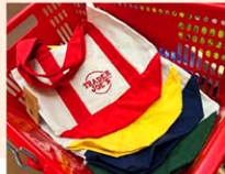
「Trader Joe's (トレーダージョーズ)」のミニトート。9月18日より再販売されている

トレーダーズ・ジョーズのミニトートが売り切れるに なるほどの人気ぶりだ。2023年の最初の売り出し から2回目も店舗の前に行列ができた。