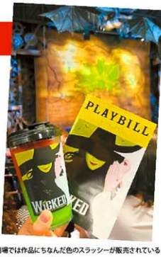
劇場では作品にちなんだ色のスラッシャーが販売されている

2003年開幕。作品はその年のトニー賞で10部門にノミネートされ、衣装デザイン賞や主演女優賞などを受賞。また、ドラマ・デスク賞やグラミー賞も受賞している。おすすめポイントは、壮大な舞台演出と何度も聞き返したくなる名曲の数々、そして「オズの魔法使い」の裏側を描いた感動のストーリー展開。エルファバとグリンド、二人の友情や正義の葛藤をテーマにした「女の友情物語」には心打たれること間違いなし! 思わず口ずさみたくなる名曲が多いのも愛される理由の一つ。特に、一幕の最後にエルファバが歌う「Defying Gravity」は圧巻!