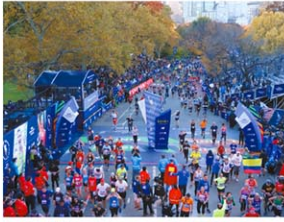
公式 Facebook より

世界中からランナーが集まるニューヨークの一大マラソンイベント。5つの行政区にまたがるコースは26.2マイル(およそ46.16キロ)、各エリアでおすすめの観戦場所は公式HPで確認。ゆっくりとマラソン観戦を楽しみたい方は有料チケットも発売されている。