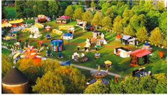
Aerial view of Luna Luna in Moorweide park, Hamburg, Germany, 1987.

Luna Luna: Forgotten Fantasy 「ルナルナ:忘れられたファンタジー」展 期間:11月20日~ 場所:ザ・シェッド(The Shed)