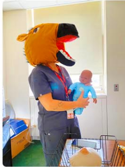
病院で出会って仲良しになったDoula。馬の被り物でお迎えしてくれました