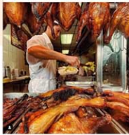
Wah Fung No 1の公式インスタグ ラム (wahfungno1) よりスクリー ンショット=2023年12月29日

ニューヨークで、TikTok撮影目当ての人々によるオー バーツーリズム(観光公害)が定着している。チャイナタウ ンのWa Fung No.1などが被害に遭っている。