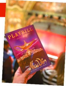
10周年記念のPlaybillは一段と盛りやかに

2014年開幕。おなじみのディズニー映画を基にした作品で、華やかな舞台美術と楽曲で高い評価を得た。トニー賞では、ジーニー役のジェームズ・モンロー・アイグルハートが最優秀助演男優賞を受賞。おすすめポイントは、「A Whole New World」をはじめとする名曲の数々と、アラジンの世界を忠実に再現した華やかな舞台演出。よく知っている楽曲と物語、ミュージカルらしい華やかさ、子連れにも楽しめる内容の3点揃いで、ブロードウェイ初心者にもオススメ。