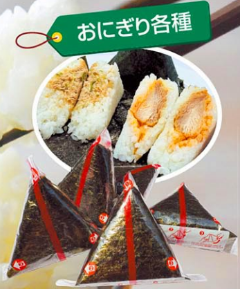
スパイシーツナ、サーモン(塩鮭)、ツナマヨ、照り焼きサーモン、スパイシー唐揚げなど豊富なメニューを揃えています。