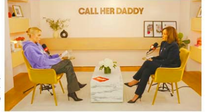
現職副大統領にバーカー姿で話すクーパー。ポッドキャストとしての収入は女性でトップだ

「葉っぱをやったからって、監獄に入れられるべきではないです」とハリス。黒人選手2人は即座に「イヤー、イヤー」と笑顔で同意した。大麻が合法化されている州は増えているものの、違法とされる州で逮捕されるのは黒人が圧倒的に多いという背景がある。