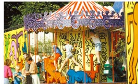
Visitors ride Keith Haring's painted carousel. Luna Luna, Hamburg, Germany, 1987. ©Keith Haring Foundation/ licensed by Artstar, New York.

11月にはついにニューヨークのザ・シェッドで開催されることになった。展示される乗り物は、あくまで観賞用だが、ティヴィット・ホックニーの没入型空間や、キース・ヘリングやケニー・シャーフのカラフルで愉快なキャラクターで覆いつくしたメリーゴーランド、「ダリドール」なるサルバドル・ダリのミラー館や目玉焼きのオブジェで装飾した楽しい迷路など、見ているだけでファンタジーの世界に引き込まれることだろう。