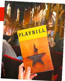
天才と称されるリッパード・ニコル・ミランダが脚本、作詞、主演を務めたことでも知られる作品