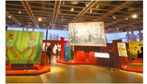
Edge of Ailey 展覧会風景

期間:9月25日~2025年2月9日 場所:ホイットニー美術館(Whitney Museum of American Art)