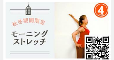
こちらから動画をご覧いただけます