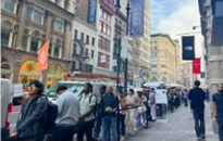
「ジーユー ソーホー ニューヨーク店」 オープン前の様子 (9月19日、午前9時)