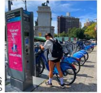
シティバイクが公表している最新のデータによれば、 2024年6月の平均利用回数は15万8,975回、年間会員総数 は12万7,485人(19日、ブルックリン区)

「シティバイク」にはバイクを移動させる利用者にポイ ントを与える「バイクエンジェルス」制度があり、月に 6000ドルも稼ぐ「パーワージェル」がいる