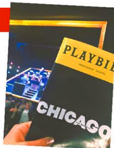
舞台上はオークストラピッドが組み込まれているのも特徴のひとつ

1975年開幕。1920年代のシカゴを舞台に、犯罪とスキャンダルをブラックコメディとして描いた作品で、1996年にリバイバル版が公演を開始し、現在も続くロングラン公演となっている。トニー賞では、最優秀リバイバル・ミュージカル賞を受賞しており、数々の栄誉を獲得。おすすめポイントは、洗練されたジャズ音楽とスタイリッシュなダンス、そして大人向けのユーモアや社会風刺が散りばめられたストーリー。