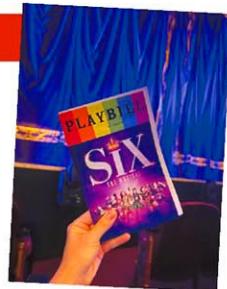
2025年には日本で再来日・日本キャスト版が上演される

2021年開幕。イギリス王ヘンリー8世の6人の元妃たちが自分の物語をポップに歌いながら語る、斬新な歴史ミュージカル。トニー賞では、最優秀衣装デザイン賞や最優秀オリジナル楽曲賞などを受賞。おすすめポイントは、キャストが6人しかいないとは思えない、エネルギッシュなパフォーマンス。ブロードウェイ公演には珍しく休憩なしの80分。