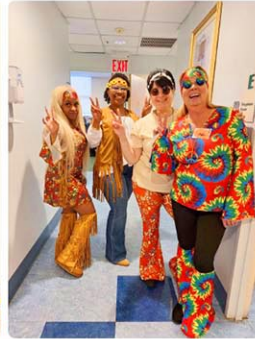
もはや何のキャラクターかわからないけど、楽しそうに働く病院の人たち

です！産婦人科のドアを開けるなり、目に飛び込んできたのは様々なコスチュームを身にまとい働く人たち。「えっ！？こっちは病院やんね？」と日本では見られない光景に一瞬戸惑い