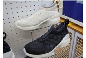
3Dプリンターで靴底を作製したミズノの「3D U-Fit(ユーフィット)」=26日午後、大阪市住之江区

商品名は「3D U-Fit(ユーフィット)」。3Dプリンターによる靴は実用例があるが、靴底を足型に合わせるのはスポーツ用品業界で初とい