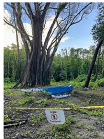
パラオ・ペリリュー島中央部にある日本兵の集団埋葬地=9日

太平洋戦争の激戦地パラオ・ペリリュー島に米軍が上陸し、日本兵約1万人をほぼ全滅させてから27日で80年。戦没者の遺骨収集を進める厚生