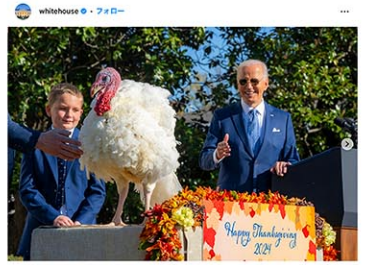
whitehouse © フォロー BidenAmerican、そのほか「いいね！」しました whitehouse © Today, President Biden pardoned the 2024 National Thanksgiving Turkey - Peach and Blossom... 目を覚まし トランプ大統領をすべて見る 23/08/24

米国で多くの家庭が七面鳥料理を楽しむ28日の感謝祭の前に、バイデン大統領は25日、ホワイトハウスの南庭で毎年恒例の「七面鳥恩赦式」を開いた。来年1月の退任を控え、在任中最後の式典となったバイデン氏は演説で大統領の任期を振り返り「人生最高の