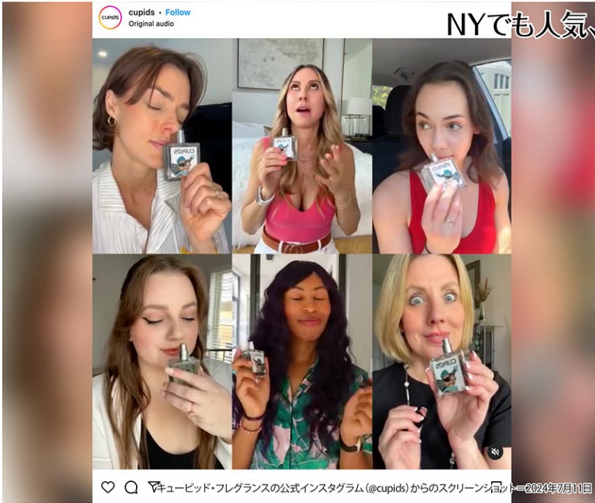
♡ Q フェロモン・フレグランスの公式Instagram (@cupids) からのスクリーンショット = 2024年7月11日

デートアプリに失望した若者たちの間でフェロモン香水が話題になっている。「異性を惹きつける」との触れ込みで、SNSのコンテンツとしても300%増。ソーホーにあるフレグランスとスキンケアのブティック、オズワルド・ニューヨークでは、1日に1回はフェロモン香水についての問い合わせがあるという。しかし、その効果を疑問視する声も上がっている。ウォール・ストリート・ジャーナルが25日、伝えた。