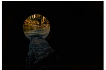
写真はイメージ Timothy L Brock / Unsplash

【ニューヨーク共同】米紙ウォールストリート・ジャーナルは25日までに、米電気自動車(EV)大手テスラが米南部テキサス州の工場から出た廃水を州の規定に違反する方法で下水道に流すなど環境規制に繰り返し反したと伝えた。増産計画を優先し、必要な措置を放置していた可能性がある。