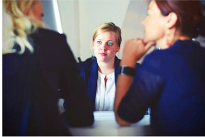
写真はイメージ

転職を希望するアメリカ人の数が10年ぶりの高水準に達していることが、世論調査会社ギャラップが四半期ごとに実施する職場環境を巡る意識調査の最新データで明らかになった。ただ、ホワイトカラー職の雇用市場が冷え込んでおり、転職は容易でなく、より多くの労働者が行き詰まりを感じ、疎外感を抱きながら働いている。ウォール・ストリート・ジャーナルが3日、伝えた。