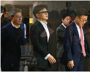
韓国与党「国民の力」の議員総会中、一時会議場の外に出た韓東勲代表（中央）=6日、ソウル（共同）

【ソウル共同】韓国内閣「国民の力」の韓東勲代表が尹錫悦大統領の弾劾訴追に賛意を示した6日、国会では憔悴した表情を浮かべた与党議員らが行き来した。対応を協議する会議室前