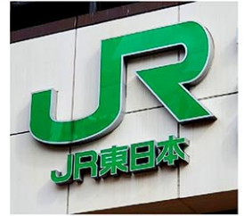
JR東日本の看板

東日本の値上げ率は普通運賃が平均7.8%、通勤定期が平均12.0%、通学定期が平均