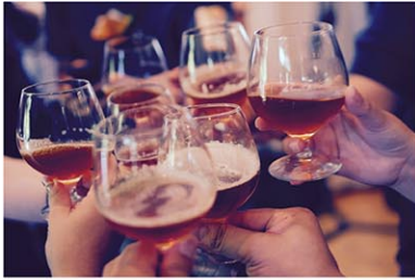
写真はイメージ Yutacar / Unsplash

ホリデーシーズン真っ只中、家族や友人と酒を楽しむ機会が通常よりも多いのではないだろうか。若年層の中でも、とりわけ男性の「飲み過ぎ」は減っている一方で、