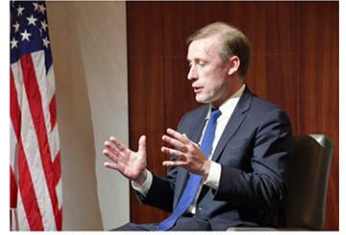
シンクタンクのイベントに登壇したサリバン米大統領補佐官＝4日、ワシントン

【ワシントン、キーウ共同】サリバン米大統領補佐官（国家安全保障問題担当）は5日、ウクライナのイエルマーク大統領府長官とホワイトハウスで会談し、将来的なロシアとの停戦交渉でウクライナが優位に立てるよう、戦況を改善する戦略を協議した。来年1月に就任するトランプ次期米大統領は交渉による早期の戦闘終結を唱えている。