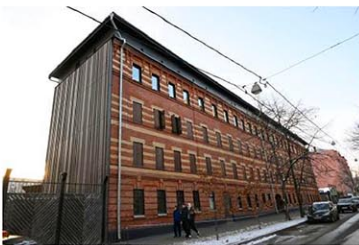
閉鎖された国立強制収容所歴史博物館=11月、モスクワ（共同）

【モスクワ共同】旧ソ連の独裁者スターリンが主に1930～50年代に行った大粛清や政治弾圧の資料を展示するモスクワの国立強制収容所歴史博物