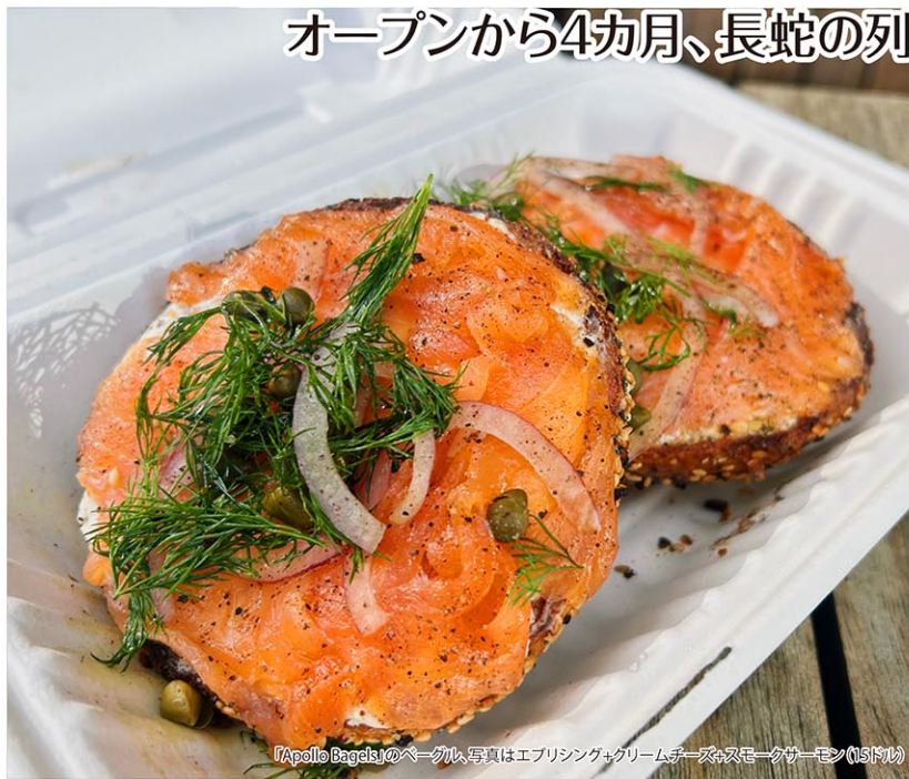
「Apollo Bagels」のベーグル。写真はエブリシング&クリームチーズ+スモークサーモン(15ドル)

数あるニューヨークのベーグルの中で、あえて「断面」を見せた新スタイルで注目を集める「アポロベーグル(Apollo Bagels)」。ウエストビレッジにある新店舗では、オープンからたった4カ月しか経っていないにもかかわらず、人気のあまり立ち退き騒ぎにまで発展したんだとか。話題の店に足を運んでみた。