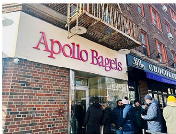
ウエストビレッジの「Apollo Bagels」にできる行列

ニューヨークのベーグルといえば、生地、食べ方と選択肢が多いのが特徴だが、同店のベーグルは「トースト一択」で、ベーグルの種類は塩気のあるサワー生地から作られたプレーン、エブリシング、セサミの3種類のみ。トッピングの種類もサーモンやトマトといった基本の食材しか置いていない。そして提供スタイルは街中ではあまり見かけない断面を見せた「ビジュ推し」で、見た目はベーグルというよりピザに近くらい。