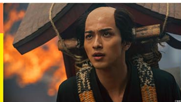
2025年新大河ドラマ「べらぼう」 1月5日スタート！