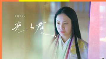
大河ドラマ「光る君へ」 全話オンデマンドで！