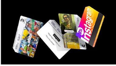
「MTA」と「Instagram」がコラボした限定メトロカード

(P1 からつづく) 当初の予定では2024年中に完全移行となる予定だったが、今のところ具体的な日程は発表されていない。なので、慣れ親しんだ磁