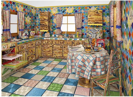
Liza Lou (b. 1969), Kitchen, 1991-96. Beads, plaster, wood, and found objects, 96 x 132 x 168 in. (243.8 x 335.3 x 426.7 cm). Whitney Museum of American Art, New York; gift of Peter Norton 2008.339a-x. Photograph by Tom Powel. © Liza Lou

ライザ・ルー（1969年ニューヨーク生まれ、ロサンゼルス育ち）の『トレーラー』（1998-2000）は、古き良きアメリカを実物大で再現したアメリカン・トリロジー・シリーズの3作目である。現在、ブルックリン美術館の入口パビリオンの右側に設置されている。同パビリオンは1992年、美術館の拡張プロジェクトの一環として、磯崎新とジェームズ・ポルシェが設計。入館料を払わなくてもイベントに参加できるコミュニティスペースとして使われており、私が美術館を訪れた10月末には、左半分のスペースで大統領選挙の期日前投票が行われていた。