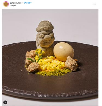
ジュンシクの公式インスタグラム (@jungsik_nyc) よりスクリーンショット=2024年5月15日

2024年ミシュランガイドの発表会が9日、ヘルズキッチン「Glasshouse」で開催された。ニューヨーク市では韓国料理の「Jungsik」が2つ星から3つ星に昇格して、参加者を驚かせた。市内で3つ星レストランが誕生したのは12年ぶりだ。同日、イーターが伝えた。