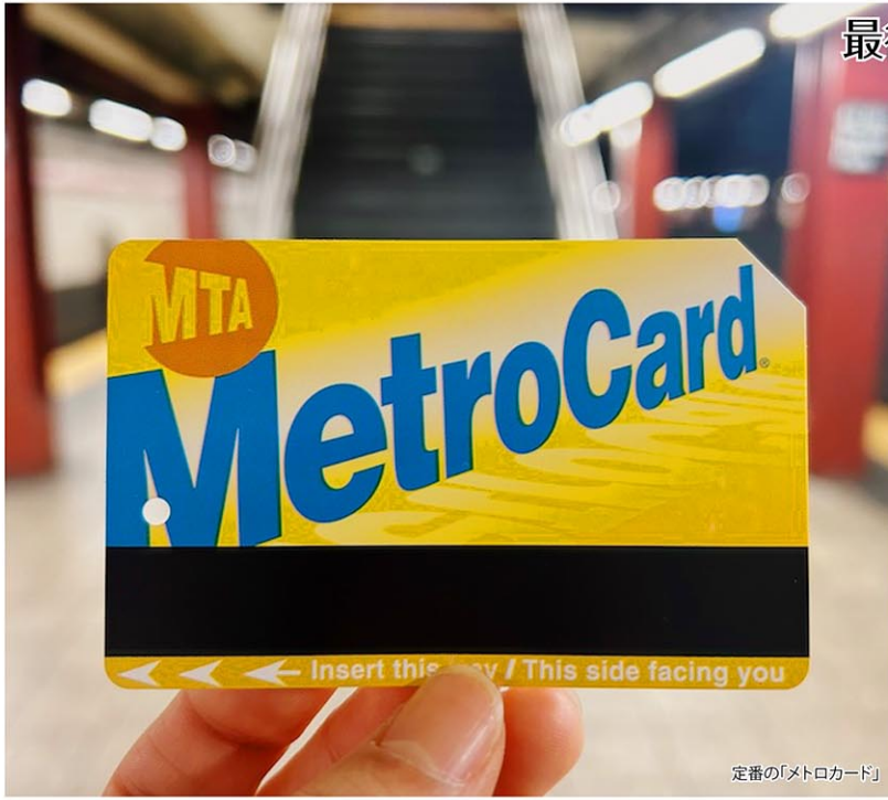
定番の「メトロカード」