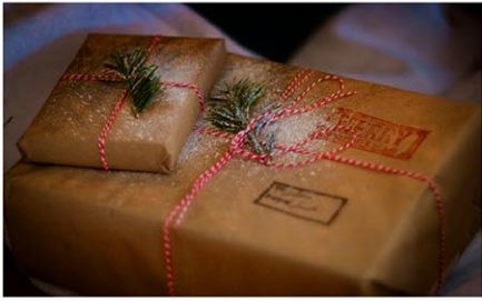
写真はイメージ Nathan Lemon / Unsplash

ホリデーシーズンと切っても切り離せないギフトを巡り、ニューヨーク州はオンライン宅配注文時に「ロスト」などの事故が起こる可能性が全米で2番目に高いことが明らかになった。トップはハワイ州。5日付のシークレットNYCは、早めの対応を促している。