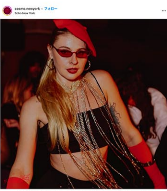
奇抜なファッションの人は入店の可能性が高い。= 2024年12月5日

客のインスタグラム のフィードを見て入店 の可否を決める、ユニークなクラブ「Cosmo (203 Bowery)」がこのほど、ローワーイーストサイドにオープンした。タイムアウトが6日、伝えた。