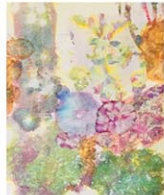
Joyful Harmony_7x5 inches_Solvent transfer soft pastel and collage on washi

東綾子が、2015年から始めた「光の記憶」シリーズを個展として展示。美しい自然の風景を撮影し、写真をプリントして除光液で和紙に転写する技法で制作。板東は「自然の中で感じる温かい光のエネルギーと空気感を表現しています。そこにはきっと浄化のエネルギーも流れているのでしょう。それを皆さんと共有できればうれしい」と話す。