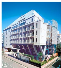
渋谷教育学園渋谷中学高等学校

A 生成AIを始めとする科学技術の進化によって、大きな影響を受けるのは、学ぶ内容だと思います。自分自身の考えと引用や参考文献を区別し、思考を深める内容に変化していくと思います。また使うツールが変化することで、学び方もそれに伴って、変化していくと考えています。学校は、社会の影響から無縁ではありませんが、自分の頭で考えること、創造性、想像性を育てることの大切さは残っていて欲しいと思っています。