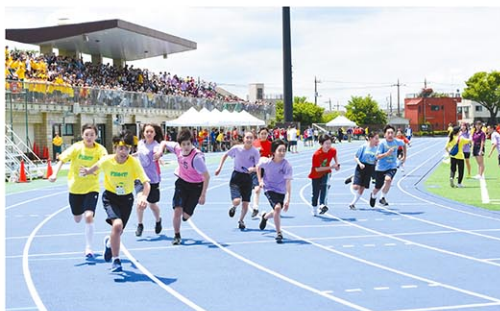
スポーツフェスティバル

Q 日本においては、ここ数十年だけでも、価値観や倫理感が大きく変化しているように思います。そのような変わりゆく倫理感に対して、日々の学校生活・授業のなかで、これまでどのように対応されてきたのでしょうか？ また、今後は、生成AIに代表されるデジタル化が飛躍的に進展し、人間に求められる役割も変わってくるかと思いますが、時代の変化を受けて、御校における「自調自考」のあり方についても変化するとお考えでしょうか？