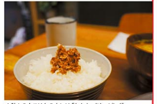
▲熱々の白ごはんの上には「おかか」をトッピング

シティでの挑戦は非常に楽しみです。土・日は観光客を含め、多くの人に来てしてもらえんと思いますが、平日の朝の動きは気になります」と担当者。マンハッタン区の忙しいオフィスワーカーと、朝9時30分から朝食を販売する同店との化学反応にも期待を寄せる。