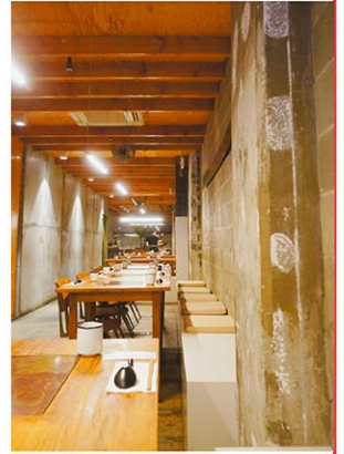
▲スタイリッシュかつ温かみのある内装

味覚、視覚を駆使した新たなアプローチでニューヨーカーの朝食に新たな風を吹き込み続ける「OKONOMI・YUJI Ramen」、マンハッタンでの営業は残り