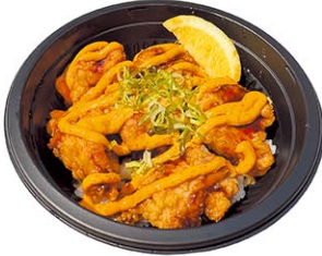
スパイシー唐揚げ丼 $8.99

醤油ベースのタレに漬け込み、下味がしっかりとついた唐揚げはダイノブの人気メニュー。食べ応えのある唐揚げに、唐辛子の辛みを感じる自家製スパイシーソースが決め手です。