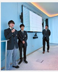
インフォメーション・セッション

特徴的なカリキュラムの一つとして、Senior (G11, G12) Saturday Morning ProgramのDebate and Public Speakingがあります。このプログラムは、毎週土曜日の午前中に行われており、ディベートもパブリックスピーキングもすべて英語で行われます。