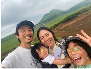
熊本県阿蘇山付近の草千里ヶ浜で撮った家族写真