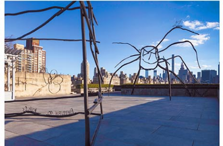
Installation view of The Roof Garden Commission: Petr Hlail, Abetare, 2024