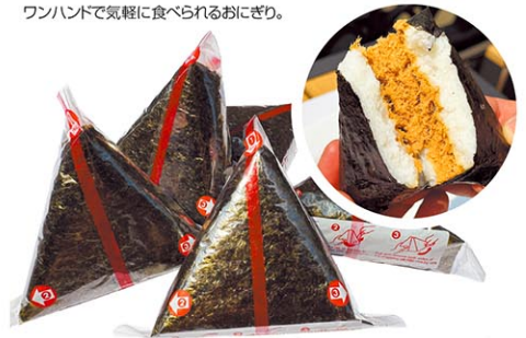
スパイシーツナ $2.79 照り焼きサーモン $2.89 サーモン(塩鮭) $2.59 スパイシー唐揚げ $2.89 ツナマヨ $2.79

定番の具材から、ダイノブのオリジナルまで、豊富なメニューを楽しめます。焼き海苔のピリッとした食感と風味を楽しめます。