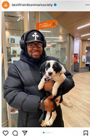
動物保護センターの保護施設は犬でいっぱいになっている。

ニューヨークのシェルターに里親が見つからない犬があふれ、「危機的な状況」になっている。ペットが欲しい人は、シェルターで見つけよう!