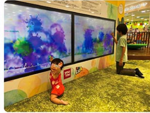
福岡県の大型ショッピングモールで遊ぶ兄妹

僕の気持ち全然わかってくれへん！」と泣かれてしまって困惑。小学四年生ともなると、反抗期とまではいかないものの少し気持ちのすれ違いが始められるようで、大事な時期にしっかりと息子を見て向き合えていなかったことを激しく反省。お仕事ばかりしている場合じゃない！と思いつつも、まだまだ残る今回の滞在でのお仕事を責任