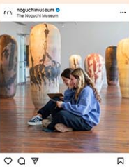
ノグチ美術館で7月8日から8月1日までスタジオアート制作集中コースを開催

ニューヨークの美術館はMETやMOMAだけではない。イサム・ノグチ庭園美術館、Bansky Museumなどお勧めの15館に行ってみよう。