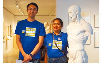
イベント公式HPより

ニューヨークの歴史的建築や有名施設の中を見学できるイベント。一般公開されていない建築施設なども、このイベント期間中は建物内に立ち入ることができるなど、貴重な機会となっている。一部、有料で予約が必要な場合もあるため、詳細は公式HPで。