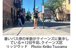
暑いバス停の半数がクイーンズに集中している = 12月午前、クイーンズ区 リッジウッド

「暑くてたまらない」バス停に注意 クイーンズやブロンクスでアジア系に影響 (8/12) ニューヨーク市内にあるバス停は1万5000カ所を超える。シェルターがあるのは5分の1、街路樹が影を宿すのは3分の1に過ぎない。