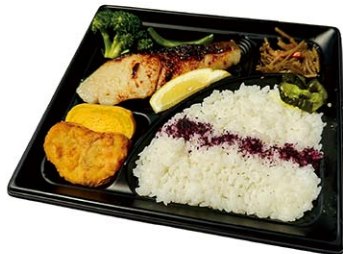
銀鱈の西京漬弁当 $15.99

西京味噌を使用した特製味噌だれに、高級魚の銀鱈を漬け込み香ばしく焼き上げました。味噌の風味が口いっぱいに広がり、白いご飯の味を引き立ててくれます。