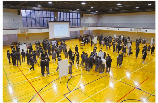
論文ポスターセッション

A まず「国際人としての資質を養う」ということについてご説明いたします。歴史的にみても、日本という国は海外との交流によって発展してきました。日本に限らず、自国の軸を持った上で、多様な人々と学びあい、共生できることが国際人の資質の基本だと考えています。また、国際化とは、ある意味「国境がある」時代の概念です。これからは、グローバル化、情報もお金も人間も世界規模で行き交って、国境がより見えにくく、複雑な世界が重なりあう時代になると思います。それだけに、求められる資質もより個人にフォーカスしたものになっていくのではないのでしょうか。