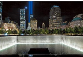
イベント公式HPより

1800 Greenwich Street, New York https://www.911memorial.org/visit/memorial/tribute-light 無料