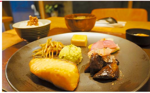
◀旬の魚からメインを選べる「焼き魚セット」

今回はそんな注目店が、8月12日~10月27日の期間限定でマンハッタン区に初進出。「人の動き、バイブスも違う