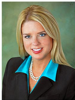
司法長官に就任したボンディ氏