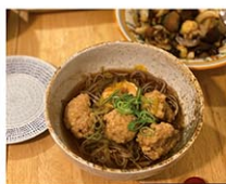
大晦日に食べた年越しそば

一方で、アメリカは大晦日の日に花火を打ち上げて新年をお祝いする習慣もあるので、そちらを楽しむこともしています。私の住むブルックリンでも、大好きなプロスペクトパークで大晦日に花火が