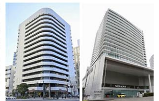
ホンダ本社（左）と日産自動車グローバル本社

電気自動車や自動運転といった成長分野で、米テスラや中国の比亞迪など新興メーカーが台頭している。