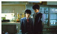
映画「時をかける少女」から

上映時間は曜日により異なる Japan Society 333 E. 47th St. (bet. 1st & 2nd Aves.) $16 (一般)、$12 (会員) https://japansociety.org/