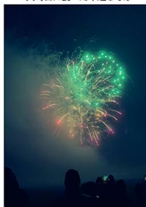
プロスペクトパークの カウントダウン花火

打ち上がるので、家族で見に行ったりします。カウンタダウン前にミュージシャンがステージを組んでライブ演奏をしていたり、花火以外でも楽しいことが盛りだくさん！近所に住むお友達とばったり会って、一緒に新年をお祝い出来るのも楽しいひと時。