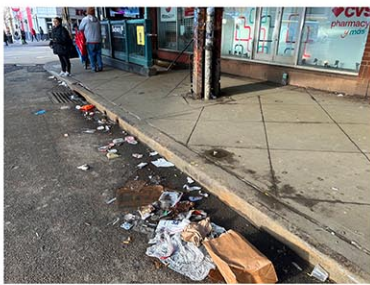
地下鉄駅構内や周辺にごみ箱が少ないため、フードも捨て放題。ネズミを引き寄せる原因となっている(7日、ブルックリン)

ニューヨーク市の地下鉄駅で最もネズミが多いのは、ハーレムの116丁目駅だったことが、ナビゲーションアプリTransitのデータからこのほど明らかになった。ニューヨークポストが5日、