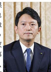
兵庫県の斎藤元彦知事

昨年11月の兵庫県知事選で、再選された斎藤元彦知事がPR会社に金銭を支払ったのは買収、被買収に当たるとして刑事告発された問題で、兵庫県警は7日、公選法違反容疑でPR会社側の関係先などを家宅捜索した。捜査関係者への取材で分かった。支払いが選挙運動への対価に当たるとかどうかを中心に捜査を進め、違法性の有無を慎重に判断するとみられる。