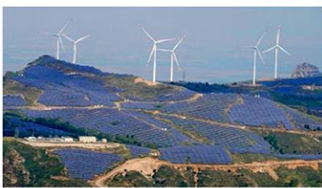
中国河北省張家口市の風力発電と太陽光発電の施設=2023年9月

【北京共同】中国政府は2024年末の太陽光発電の設備容量（発電能力）が前年末比45.2%増の8億8666万キロワットだったと7日までに発表した。風力発電も18.0%増の5億2068万キロワットだった。気候変動対策の国際枠組み「パリ協定」再離脱を表明したトランプ米大統領を尻目に、再生可能エネルギーを積極的に活用する姿勢をアピールしている。