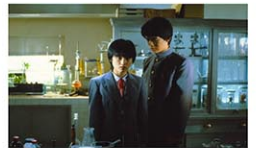
映画「時をかける少女」から © 1983 Kadokawa Corp.

上映時間は曜日により異なる Japan Society 333 E. 47th St. (bet. 1st & 2nd Aves.) $16 (一般)、$12 (会員) https://japansociety.org/