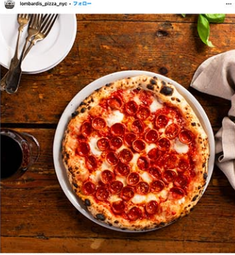
ロンバルディーズの公式Instagram (@lombardis_pizza_nyc) からスクリーンショット= 2023年4月25日

St.)は堂々の2位。1905年に開業した老舗で「アメリカ最初のピッツェリア」として知られる。薄くてカリカリのシンプルな「マルゲリータ」や殻から取り出したばかりのアサリが盛りだくさんの「クラムパイ」がおすすめ。Yelpには5000枚を超える写真が投稿されている。2024年には、積極的に質の高いレビューを行うYelpエリートによる「ピザ店・トップ100」にも選ばれている。行列ができていても気にしないこと。必ず、映える写真が撮れること请け合いた。