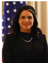
ギャバード氏 (12日、上院本会議)

【ワシントン共同】米上院本会議 (定数100) は12日、中央情報局 (CIA) などの情報機関を統括する国家情報長官にトランプ大統領が指名したトゥルシ・ギャバード元下院