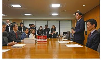
高額療養費制度を巡り、がん患者団体などと面会する福岡厚労相(右から2人目)＝12日午後、厚労省

政府が、医療費が高くなった場合の自己負担を抑える「高額療養費制度」の上限額を引き上げる方針を一部修正し、長期の治療を受けた患者の負担を据え置き案を検討していることが分かった。「治療を諦めざるを得なくなる」と不安を訴えるがん患者団体などの声に配慮した。詳細を詰めた上で近く公表する。関係者が13日、明らかにした。 直近12カ月以内に3回利用すると4回目から負担が軽減される仕組み「複数回該当」の上限額引き上げを見送る方向だ。現在、平均的な年収区で多数回該当を適用した場合の上限月額額は約4万4000円。政府方針では、2025年8月から段階的に引き上げ、27年8月に最大で約7万7000円とする予定