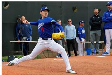
キャンプ初日、フルベンで投球練習を行う米大リーグ、ドジャースの佐々木朗希=12日、グレンデール

【グレンデール(米アリゾナ州)共同】米大リーグのドジャースは12日、アリゾナ州グレンデールで投手と捕手のバッテリー組がキャンプを迎え、投打「二刀流」復活を目指す大谷翔平が3月の日本