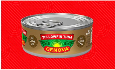
リコールになったジェノバシーフードのツナ缶 (同社の公式ウェブサイトからスクリーンショット)

米食品医薬品局 (FDA) は10日、トレーダージョーズやウォルマートなどで販売されていた一部のツナ缶が、ボツリヌス菌に汚染された可能性があるとしてリコールを発表した。CBSニュースが12日、伝えた。