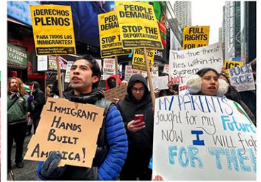
社会主義解放党 (PSL) が掲げた移民の強制送還に反対するデモ (9日、タイムズスクエア)

「クーデタ」という言葉を使い始めたのは、ドキュメンタリー映画監督のマイケル・ムーアや、ユール大のティモシー・スナイダー歴史学教授だ。覆面をした民兵が武器を携え、政府のビルに車で乗り付け、襲いかかっていく、という光景はない。その代わり、平服の若い男性らが、ハードディスクドライブを持って、連邦政府ビルに何気なく入っていく。「ホワイトハウスのお届け品だ」と言って専門用語を並べ、省庁のコンピュー