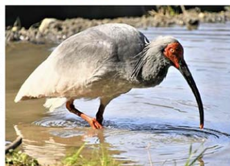
トキ=2020年3月、石川県能登市のいしかわ動物園

検討会は、能登地域の水田の調査結果から、餌となるカエルやタニシなどが数多く生息し、放鳥できると判断した。一方で、イノシシ用の電気柵