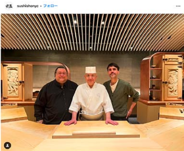
すし匠の公式インスタグラム (@sushihonyc) からスクリーンショット=2024年11月7日

1962年、東京生まれ。15歳でこの世界に入り、日本橋界隈のすし屋で江戸前に出会う。魚を昆布で巻いたり、塩、酢で締めたりする手法は後に、実は旨味を引き出すことにもなると気づいたという。「生贄か