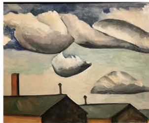
・日比久子『浮雲』1944年、油絵 19"x23"x1 1/2" 「自由にならいたいトパーズの上に見える雲にならいたい」と作品の裏に書かれている。