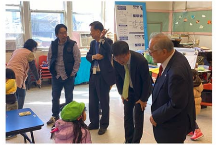
岡本学園長(右)の案内の下、子どもたちと交流する金総領事(右から2人目)